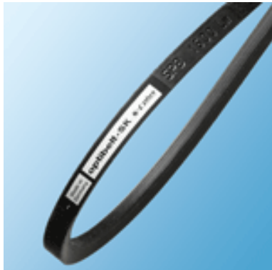
5V1250 - Schmalkeilriemen Schmalkeilriemen