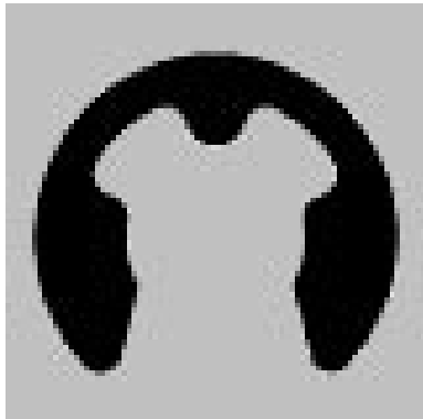
RA24 DIN 6799 SEEGER - Sicherungsscheibe für Welle DIN 6799 Sicherungsscheibe für Wellen