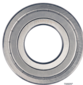
TIMKEN® REPRESENTATIVE IMAGE